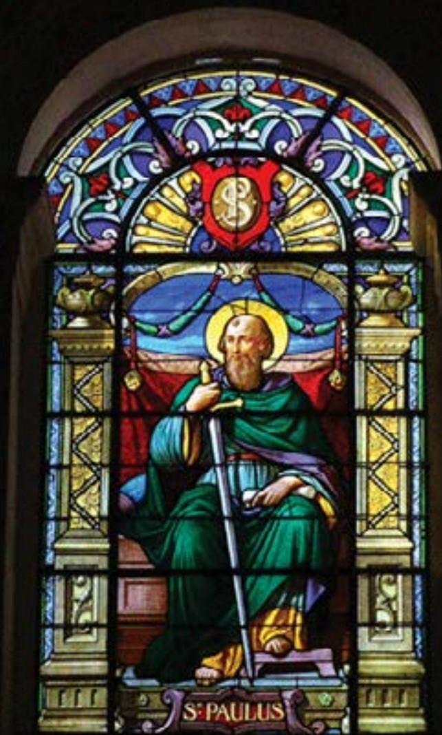
Vitral de la Santa Iglesia Catedral de Cienfuegos.