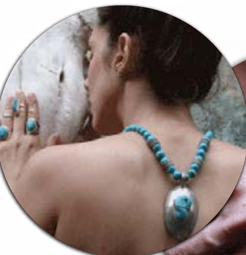
Plata y Turquesa

Behique es un grupo de orfebres primitivistas sin formación académica. Tenemos como premisa cardinal la ejecución de ideas provenientes del imaginario de cada miembro, con técnicas aprendidas o improvisadas en el proceso de creación de las obras. Nos declaramos amantes de las sombras, elogiadas -al decir de Tanisaky- por la cultura oriental. Más allá de piezas perfectamente pulimentadas y precisas, perseguimos la elegancia en las incertezas propias de una búsqueda artesanal de la belleza y los materiales que empleamos, consecuentemen-