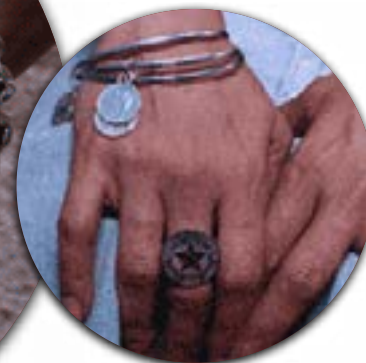
Bisutería de plata con monedas antiguas