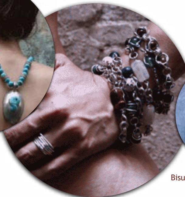
Plata y piedras naturales