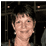
Carmen Capdevila Edición General