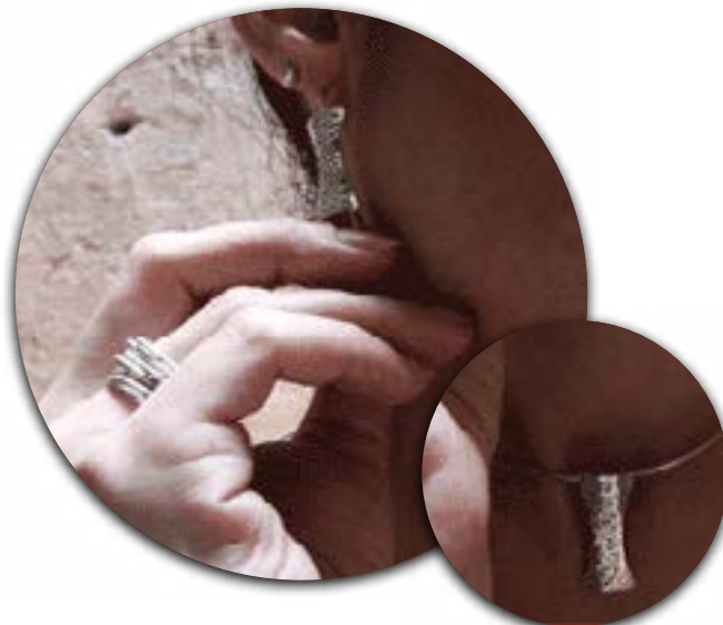
Orfebrería Behique. Plata forjada al fuego.

En alguno de los casos la orfebrería opera como una afición como pueden representar Erik, médico intensivista y Damián, entrena-