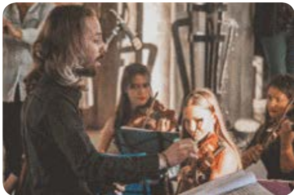
Fotografías de Diana Suárez

para reencontrarse consigo mismo en esa especie de huida y encuentro que caracteriza al verdadero creador.”