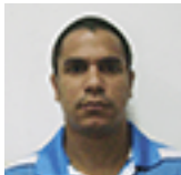
Roberto Berroa Diseño y realización