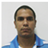
Roberto Berroa Diseño y realización