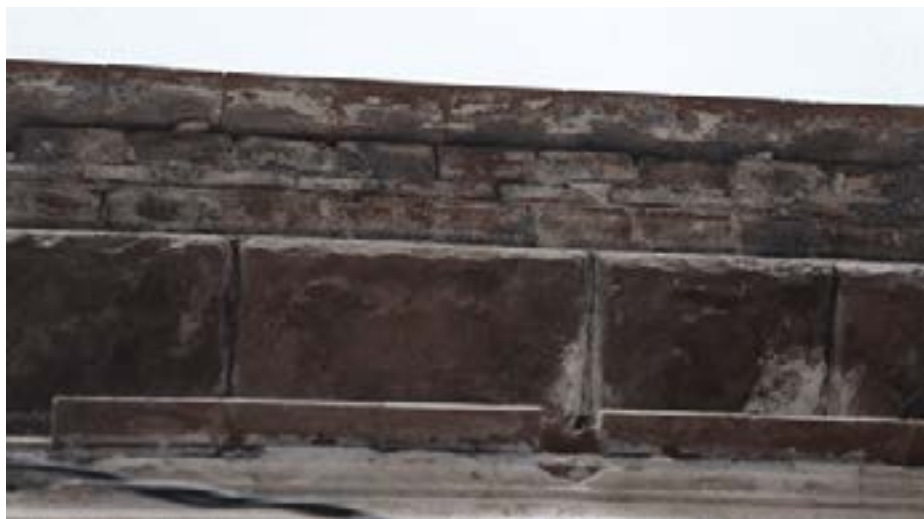
Cornisa de la vivienda número 5612 ubicada en la calle de Gazel entre San Carlos y Santa Cruz