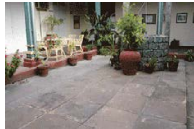
Patio interior de la casa de Galo Díaz de Tuesta, calle San Fernando número 2508

materiales, que llegaron fundamentalmente desde los Estados Unidos. Sin embargo las losas bremesas no solo se utilizaron en la pavimentación de los espacios públicos, también fueron empleadas en la arquitectura para la construcción de los pisos de los