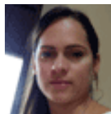
Maiden Emuet García Martínez Redacción

En portada: Fotografía de Frank Daniel Rodríguez García Título: Migración de papel 2do. Premio categoría Patrimonio Inmaterial. Concurso Lente Patrimonial/2019