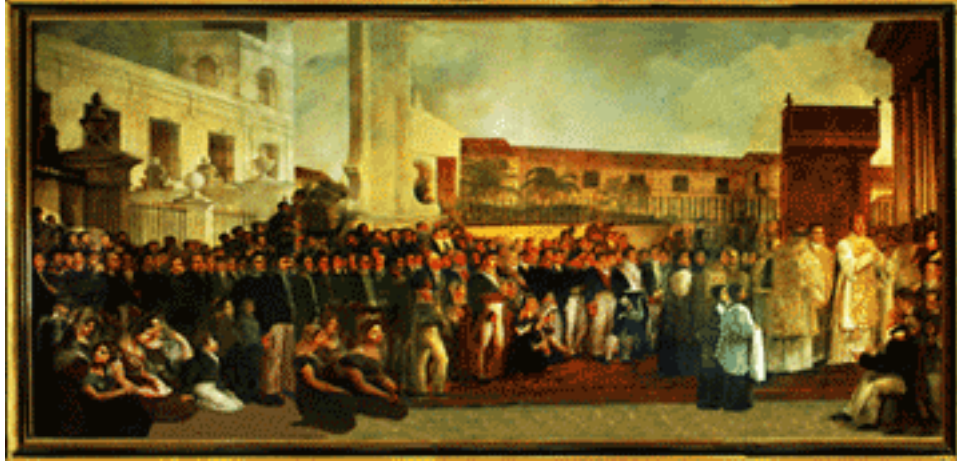
Solemne fiesta religiosa oficiada por el Obispo Espada, con motivo de la inauguración del Templete