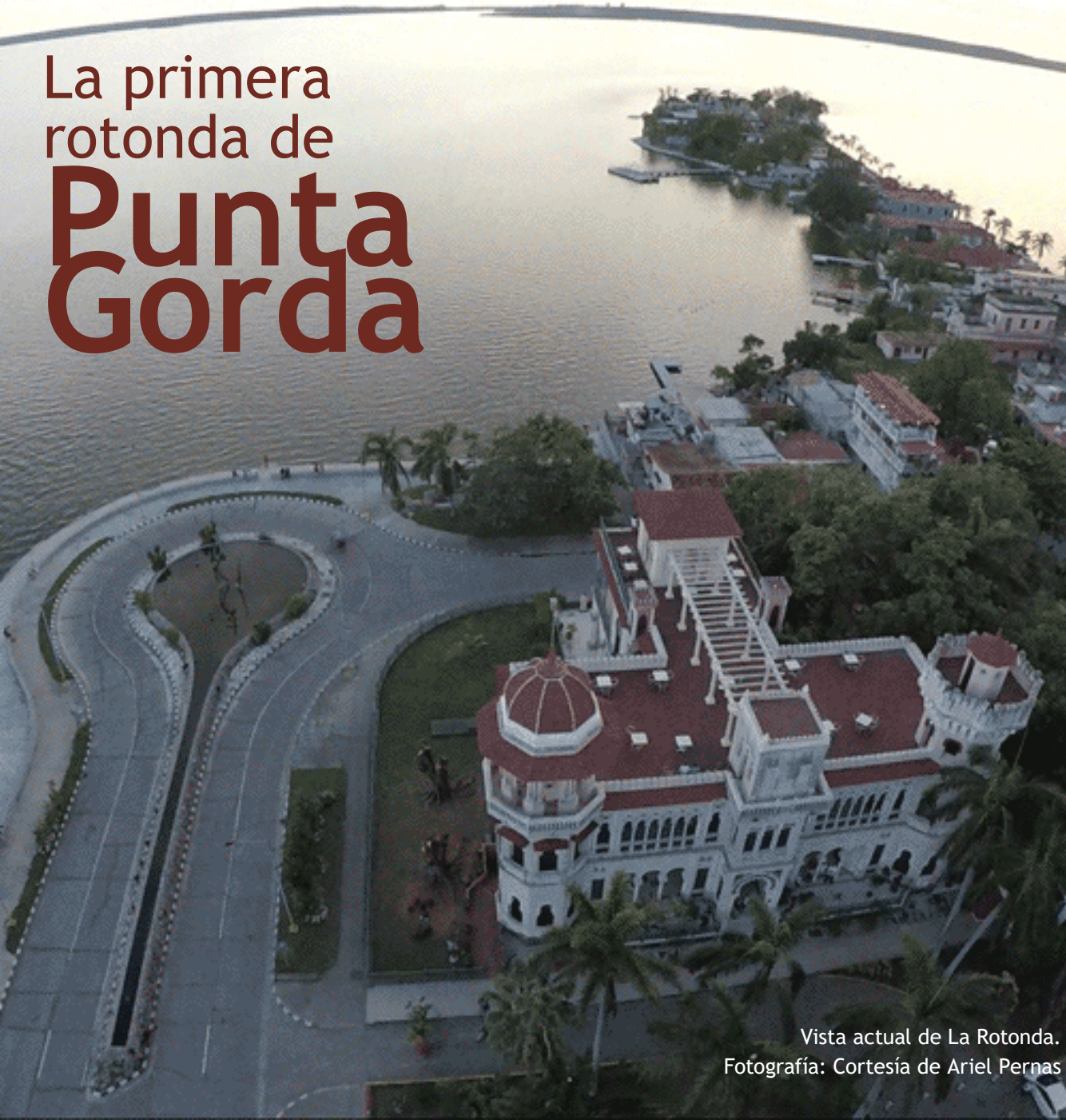
Vista actual de La Rotonda.