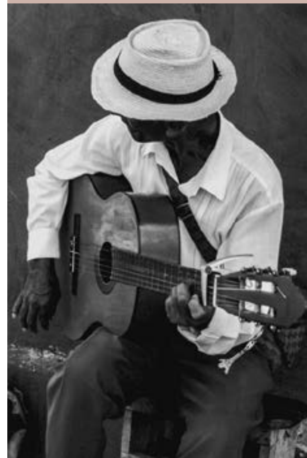
Fotografía: S/T de Edel Alejandro Fonte Vigo 1er Premio categoría Patrimonio Inmaterial