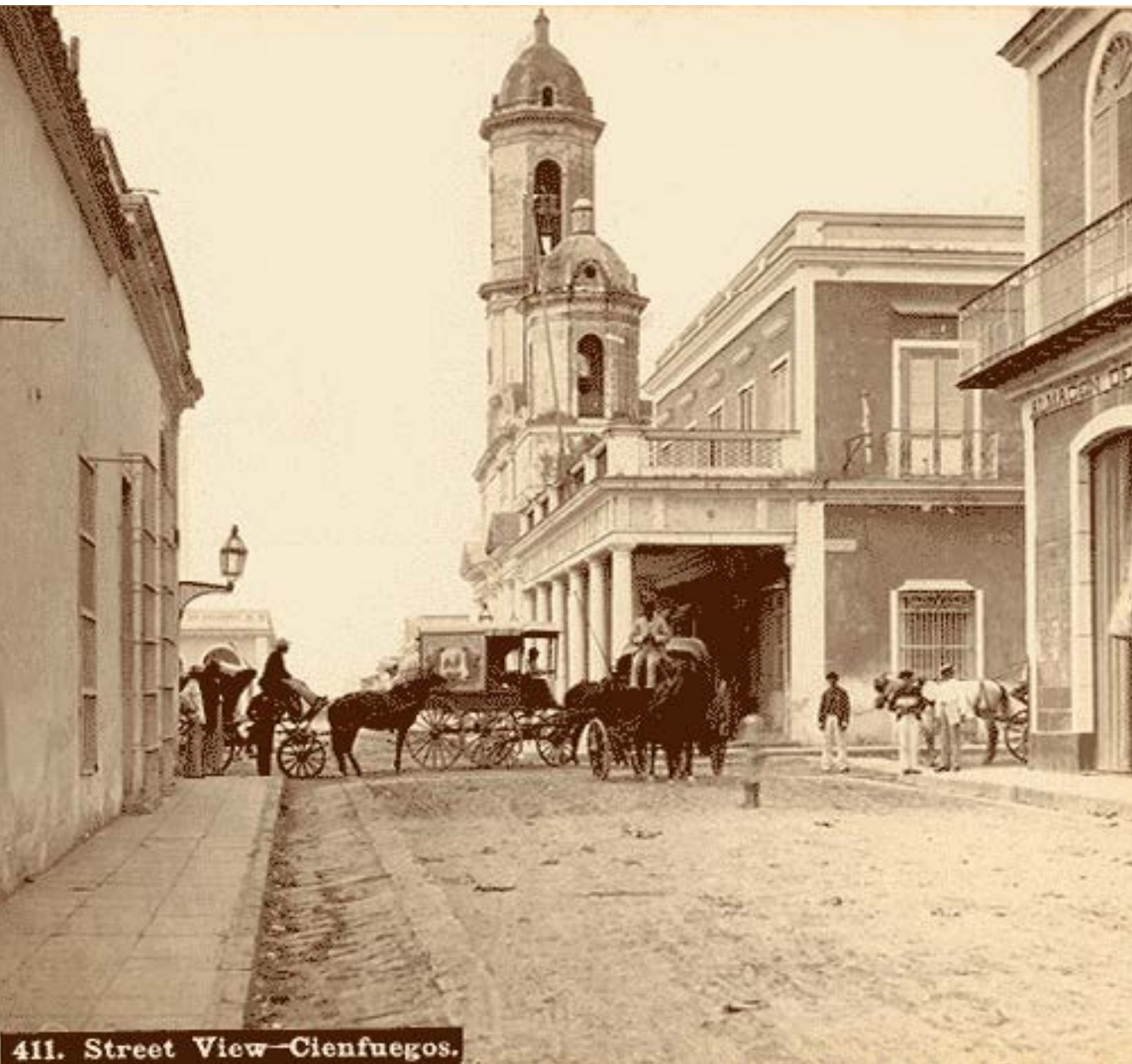
411. Street View—Cienfuegos.