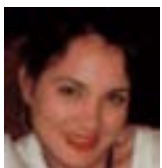
Laura Brito Redacción

Si desea suscribirse a esta revista, envíe un e-mail a: