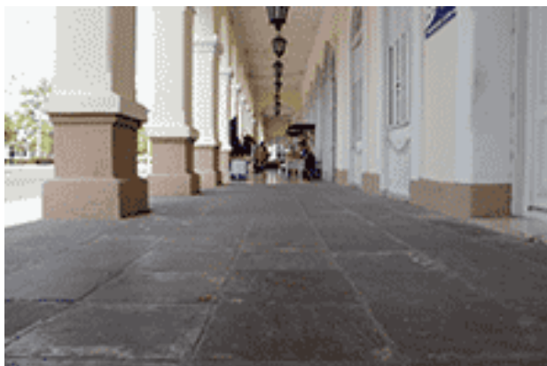
Portal del Centro Provincial de Patrimonio Cultural, calle San Fernando número 2504.

local Hoja Económica apareció el martes 29 de marzo de 1859 una nota sobre la comercialización de “losas bremesas de 24, 21 y 18 pulgadas se hallan de venta en la Agencia Mercantil de Comisiones, calle de Horruitiner n. 12.” 10