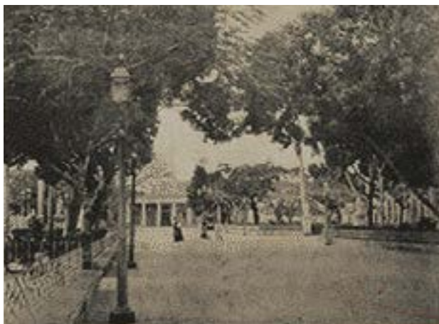
Salón Serrano.

de mezcla empleada y el valor de la mano de obra, es debido al entretenimiento que han tenido los oficiales en cuadrar y perfeccionar las juntas de las lozas que cubren el asiento, como el progresivo aumento de los cimienttos a medida que se aumentaba el terraplen para conservar la nivelación. También es muy entretenido la colocación de lozas cuando estas tienen desigual espesor y ocasionan el consumo de mucha mezcla. 18