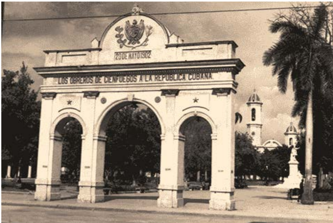
Década del 50.

Resulta improbable que exista en Cienfuegos, alguna persona que no haya visitado el parque José Martí, el mayor, más antiguo y colorido de la ciudad capital. Dicen sus amantes que posee un magnetismo comparable al del emblemático Palacio de Valle, -ubicado en el extremo sur de la propia urbe-. Solo una cultura, como la cienfueguera, podía permitirse construir y continuar su desarrollo, urbano y social, con elementos arquitectónicos de tal relieve, durante el periodo neocolonial o republicano como lo llaman otros. Tales expresiones culturales, en algunos casos, presentan rasgos característicos de la clase burguesa dominante. La ejecución de obras obedecía al patrocinio de instituciones y personas que enaltecieron a la ciudad en sus distintos estratos, que por una u otra causa, deseaban contribuir a su desarrollo desde lo individual. Por otra